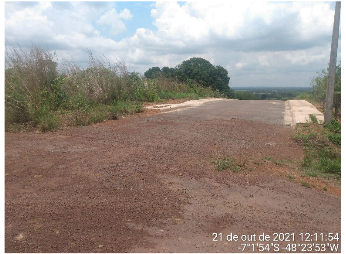
IMAGEM 05: RUA MINAS GERAIS