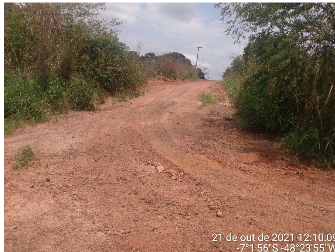
IMAGEM 06: RUA MINAS GERAIS

Carmolândia – TO, 11 de janeiro de 2022.