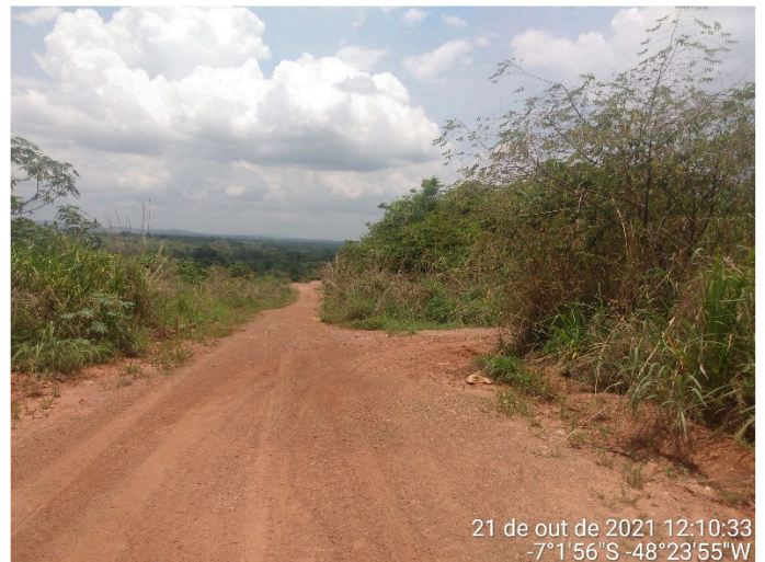
IMAGEM 02: RUA UM