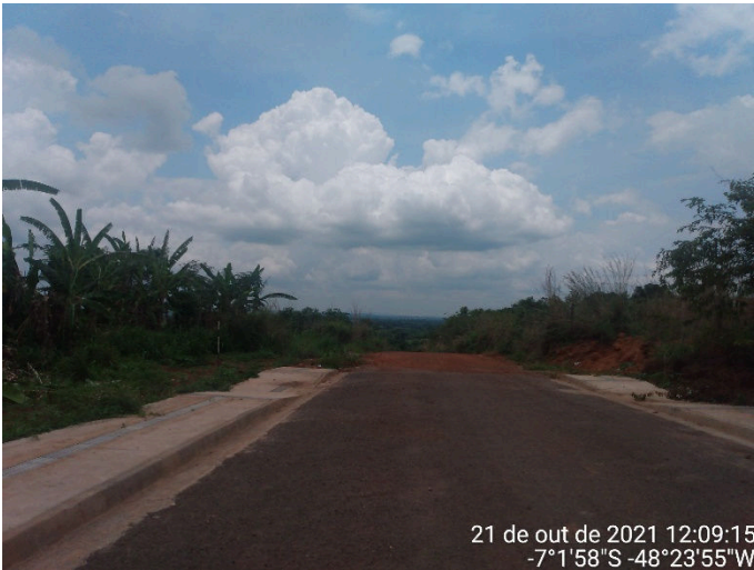
IMAGEM 01: RUA UM