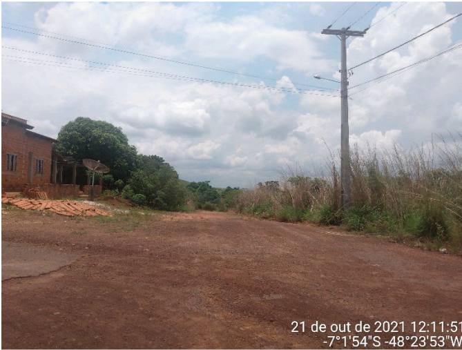
IMAGEM 04: RUA MINAS GERAIS