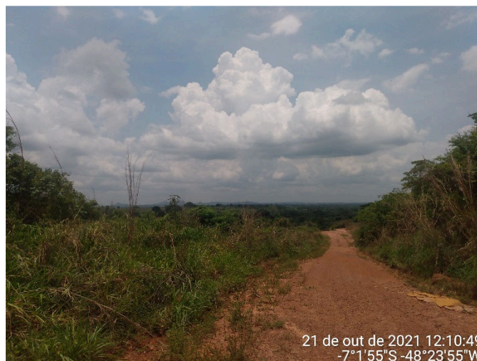
IMAGEM 03: RUA UM